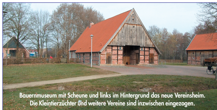
Bauernmuseum mit Scheune und links im Hintergrund das neue Vereinsheim. Die Kleintierzüchter und weitere Vereine sind inzwischen eingezogen.

„Durch den Umbau erreichen wir eine Energieeinsparung von ca. 32.000 Kilowattstunden“, so Anja Schupe.