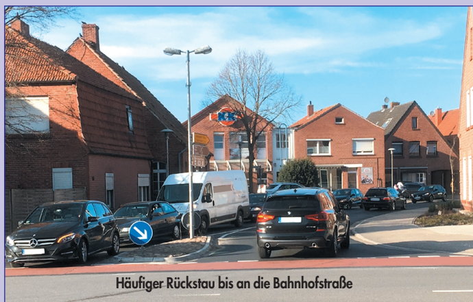
Häufiger Rückstau bis an die Bahnhofstraße

■ Die Verkehrssituation in Veldhausen gestaltet sich zunehmend problematisch. Insbesondere gilt dies für die Verkehrsteilnehmer, die aus dem Ortskern kommend die K4 befahren und dann die Kreuzung an der L 45 in Richtung Wietmarschen/Nordhorn bzw. in Richtung Neuenhaus passieren möchten. Längere Rückstaus in Richtung Ortskern und immer wieder unübersichtliche Situationen im Kreuzungsbereich sind an der Tagesordnung.