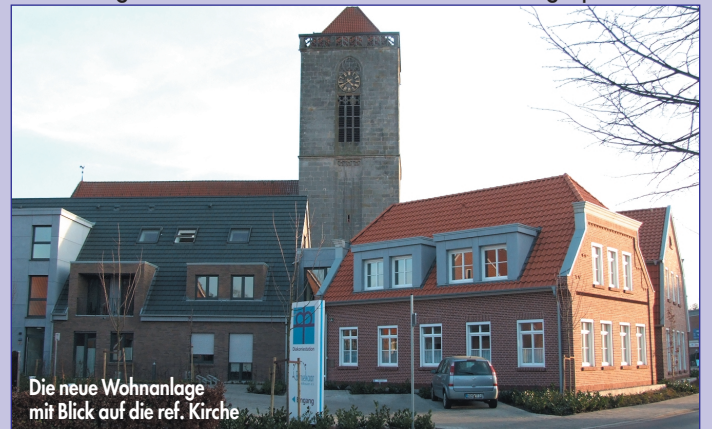
Die neue Wohnanlage mit Blick auf die ref. Kirche

■ Die neue Wohnanlage der Diakoniestation Neuenhaus/Veldhausen passt sich wunderbar in das Ortsbild ein. Hier können insbesondere ältere Menschen ihren Lebensabend in heimatnaher und angenehmer Atmosphäre verbringen. 8 Wohnungen und 12 Wohngemeinschaftsplätze - „ Bimekaar “ - wurden Mitte Januar in Betrieb genommen. Am Tag der offenen Tür kamen ca. 2000 Menschen und staunten über das gelungene Bauwerk. Im großen Gemeinschaftsraum, der auch der ref. Kirchengemeinde zur Verfügung steht, wurden Kaffee und Kuchen angeboten. Auch hier hat man an einen guten Zweck gedacht. Der Erlös wurde dem gemeinnützigen Verein „ Bimekaar “ Veldhausen e.V. gespendet.